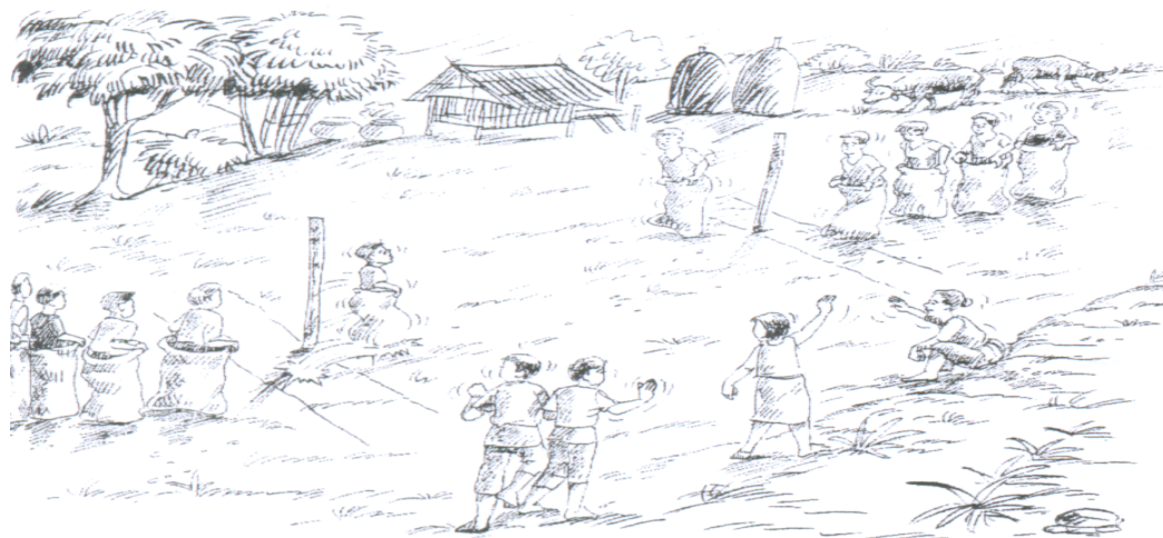
วิธีเล่นวึ่งเปี้ยวสวมกระสอบ

๑) ให้ทำสนามแข่ง ตั้งเสาเป็นหลัก ๒ เสา ระยะห่างกัน ชาย ๒๐ และ หญิง ๑๕ เมตร ทางด้านซ้าย และขวาของเสาทั้งสอง ให้ทำเส้นเริ่มเล่น ยาวด้านละ ๒ เมตร ให้ขนานกับเส้นเริ่มเล่นของเสาอีกต้นหนึ่ง ห่างจากเส้นเริ่มเล่นไปทางด้านหลัง ๑.๕ เมตร ให้เขียนเส้นประขนานกับเส้นเริ่มเล่น เรียกว่า เส้นเตรียมพร้อม ระยะระหว่างเส้นเริ่มกับเส้นเตรียมพร้อม เรียกว่า เขตเปลี่ยนกระสอบ