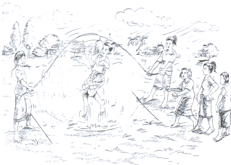
วิธีเล่นกระโดดเชือกหมู่

๑) เชือกแข่งขันให้มีขนาดประมาณนิ้วชี้ของผู้ใหญ่ ยาวไม่น้อยกว่า ๗ เมตร กำหนดเส้นยืนแกว่งเชือกห่างกัน ๕ เมตร