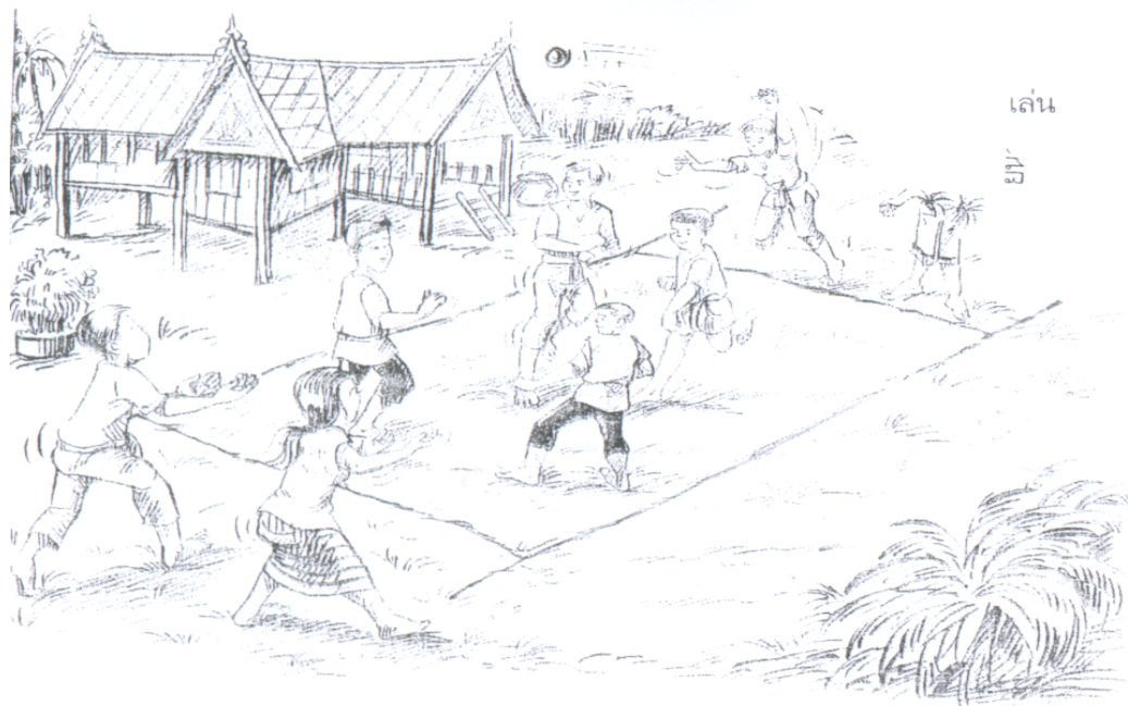
วิธีเล่นขว้างลิง

๑) สนามแข่งขันเป็นรูปสี่เหลี่ยมผืนผ้า กว้าง ๙ เมตร ยาว ๑๒ เมตร สำหรับชาย และกว้าง ๗ เมตร ยาว ๑๐ เมตร สำหรับหญิง ที่ปลายทั้งสองด้านของเส้นข้างให้ทำเส้นตรงออกไปอีก ๒ เมตร ทุกๆ ด้านเพื่อเป็นแนวเขตการขว้าง